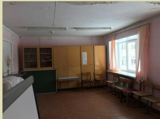
Комната будущего тренажерного зала